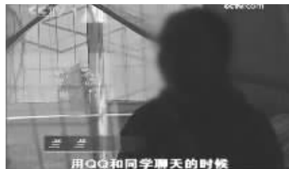
用QQ和同学聊天的时候

从“很黄很暴力”到“心神不宁”,央视针对网络色情的节目总是一不小心就弄巧成拙,不但起不到抨击效果,还让节目中出现的受访者变成网友人肉的对象。11月14日央视《焦点访谈》又将镜头瞄准了手机黄色网站,访问了一个误入手机黄色网站的中学生,受访者的“受害讲述”仍然不能让网友信服,其“查高射炮误入黄网”的言论还被封为“很黄很暴力”的2.0版。