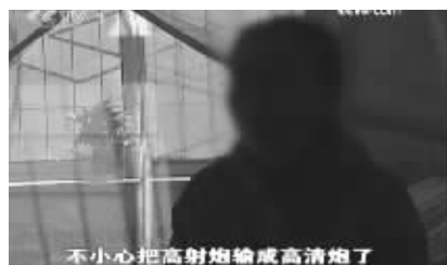
不小心把高射炮输成高射炮了