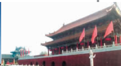
临汾市尧都山寨“天安门”