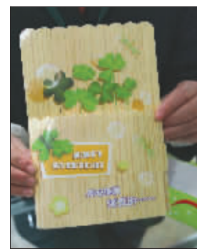
能长出草的植物贺卡