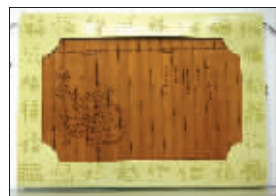
竹筒贺卡

现在逢年过节,寄贺卡的人已经不多。不过,如果寄上一张很有创意的贺卡,收到的人一定会感到惊喜。记者日前从南京市邮政局了解到,今年贺卡也在玩新潮,不再是单纯的一张卡片,有的贺卡里能长出青草来,有的能当杯垫、笔筒用。这些兼具实用性和观赏性的新型贺卡能否重新吸引人们呢?