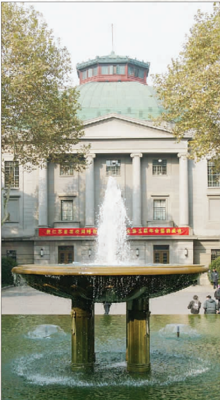
看起来,这里不像礼堂,更像是一座充满了艺术感的歌剧院