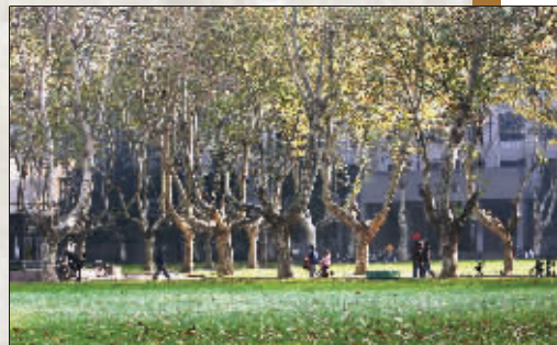
午后的校园里,梧桐下掩藏了太多“民国往事”