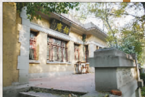
梅庵的房子不大,但发生在这里的故事却不少