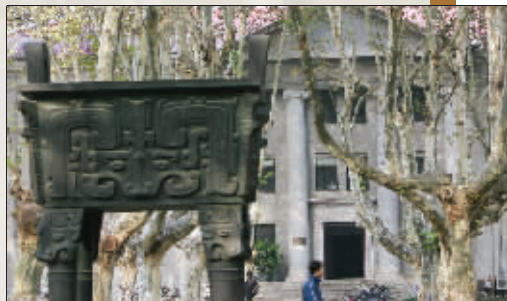
建筑系所在的中大院,有着不容忽视的说服力