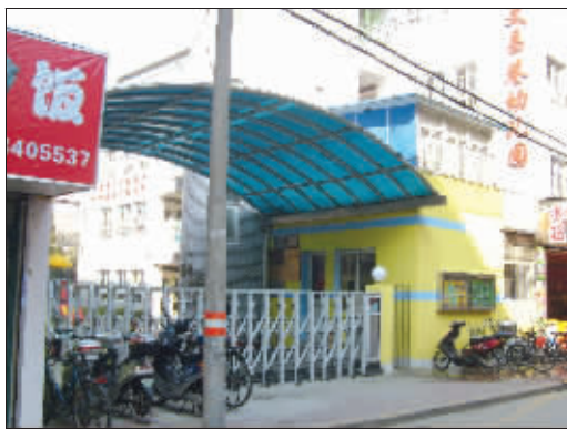
文昌巷幼儿园是白下区7所集体幼儿园之一

公办幼儿园招生名额又太少,就由街道出面办起幼儿园。集体幼儿园的房屋是公有的,但自收自支,财政不给钱。近年来,随着国家加大对幼儿教育投入,公办幼儿园与集体幼儿园员工的收入差距越来越大。