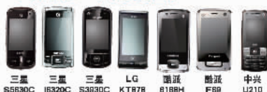
三星 S5630C 三星 I6320C 三星 S3630C LG KT678 酷派 8188H 酷派 F68 中兴 U210

这是一个最好的时代! 这是 G3 的时代! 不换卡、不换号、不登记,只需一部 G3 手机,您即可享受高速上网、视频通话、电视直播等丰富的 3G 精彩。现在购买 G3 手机更能享受高额话费补贴、超值售后服务,18 个月内主机保修,锂电池 6 个月内包换。买 G3 手机,现在好时机。G3 手机热力推荐,详询各地营业厅。