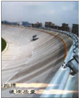
占地面积超过2.5平方公里,属国内最大,该试车场的建设将承担比亚迪未来新车型开发和道路试验的主要任务,将为比亚迪加快汽车产品开发和更新换代起到重要的作用。

与目前全国高速增长的汽车市场不相称的是,国内试车场建设相对滞后。目前比亚迪在韶关建设的汽车试验场