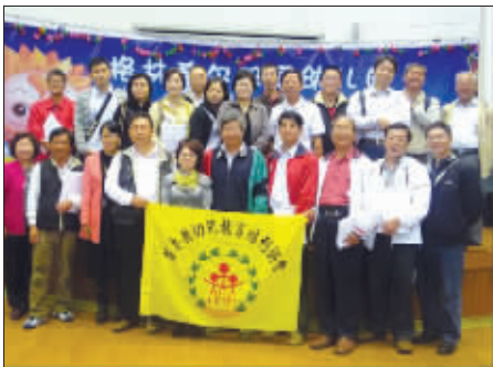
台湾苗栗县幼儿教育代表团一行22人近日来锡交流访问,海峡两岸的幼儿教师坐在一起讨论幼儿教育发展问题,其乐融融。 刘发明 陈超

交警部门接警数据显示,6起事故中,侧面相撞3起,刮撞行人、撞固定物、对向刮擦各发生1起。交通事故初查原因显示,这一周事故机动车违法行为引发事故4起,致2人死亡。其中,无证驾驶1起;其他影响安全行为引发事故3起,致2人死亡;非机动车逆行1起,致1人死亡;操作不当1起。 薛晨