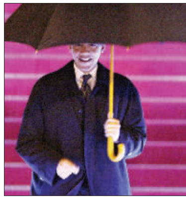
奥巴马抵达上海

对话内容包括中美两国关系、经贸、反恐、教育等方面,新华网将独家网络直播。奥巴马今天将启程去北京继续访问,并于后天离开中国。 >>>A7