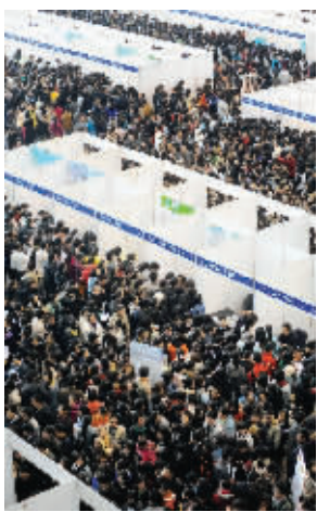
招聘会现场人山人海