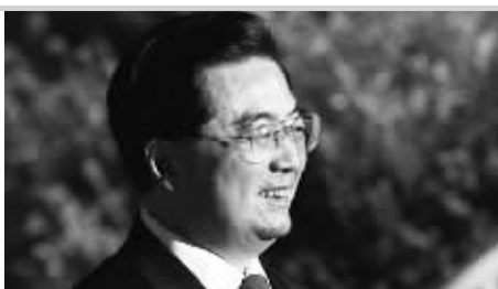
中国国家主席胡锦涛