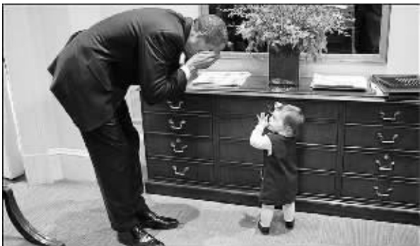
奥巴马一时父爱大发

在美国总统奥巴马就职一周年之际，白宫日前公开了一些奥巴马的罕见生活照，其中一张照片中，奥巴马竟与小孩儿玩起了“躲猫猫”。