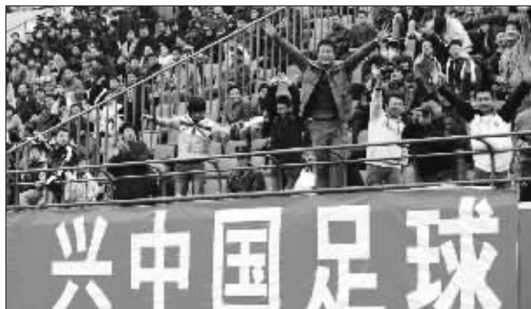
中超球市刚刚回暖,如果“休克”,损失的是中国足球 资料图片

最近几天,不少媒体都在传,中超联赛有可能暂停一年,也就是所谓的休克,以方便彻底“扫赌”。消息的来源是,一家中超俱乐部的工作人员对媒体说的,而且声称千万不要外传,事实上,这样爆炸性的内容怎么可能包得住呢?不过,这样的消息并不靠谱,这不,就连足协昨天也站出来辟谣了。