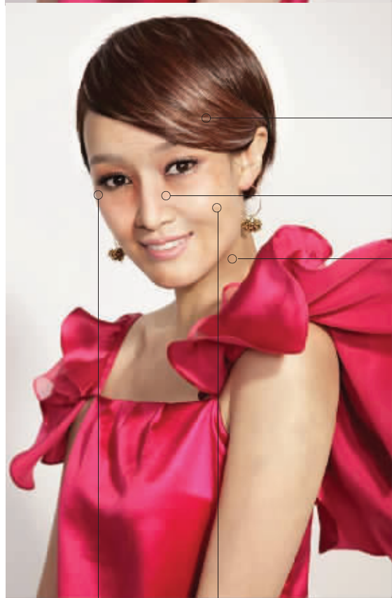
几乎是同样的手法，我们的美编如法炮制了20年后的赵子琪。