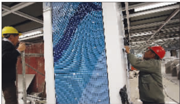
蓝色的立柱是下马坊站的特色