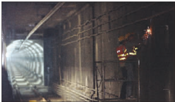
第一列列车将从这里开出

25日 地铁二号线首列列车将从下马坊站（原小卫街站）开出，在这个站和马群站间来回试跑。这个二号线装修进度最快车站昨天初露真容，记者看到它以蓝色调为主，各项工程都已进入收尾阶段，预计明年元旦前全部装修完毕。据了解，明年2月份，全线所有地铁站结束装修，进入试运营，5月通车。