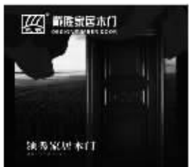
戴胜木门升级新产品

超静音木门已成为家装新宠,在南京的各大高档社区进行招商,有70%的高端装潢用的是戴胜超静音木门。戴胜超静音木门向进口红胡桃木原木为主,配高