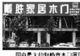
国内最大的超静音木门展厅

戴胜家居木门汉中门旗舰店(总展示厅)面积达三千余平方米,能够很直观地展示戴胜的品牌形象、优质产品和细致服务。在未来的一段时间内,该旗舰店都将成为戴胜的标志性店面。