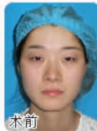
术前 施尔美·花漾女人 手术项目: 重睑、隆鼻、改脸型、颞部填充等

为了使面部五官比例更加协调,施尔美9年坚持面部精细化理念,以鼻头鼻翼矫正术、内眦开大术(开内眼角)、内眦赘皮矫正术等为技术核心,通过全职在院的权威专家对细节的精心设计,彰显东方人的五官魅力。