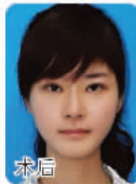
术后 求美红洗手·沈影

经典项目|面形修改 五官整形 面部除皱 隆乳美胸 吸脂减肥 OPT美白祛斑 激光绝毛 水养嫩肤 美白针 牙齿美容 祛痘祛疤 妇科整形等百余种 美丽专线:025-84488400 8008289950 www.jssem.com 地址:南京市龙蟠中路215号 QQ:1091616828