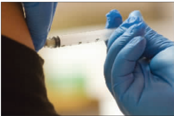
10月21日,一名美国妇女在接种甲流疫苗

随着北半球天气变凉以及普通流感开始流行,甲型 H1N1 流感病毒的“第二轮冲击波”疯狂来袭。尽管一种新型疫苗已经研制出来,但供不应求。同时有不少人怀疑态度:我应该接种吗?它是否安全?为了搞清楚这些问题,美国哥伦比亚广播公司派莱伊带领一组人马探访了美国联邦政府斥资 30 亿美元打造的甲流防疫工程。