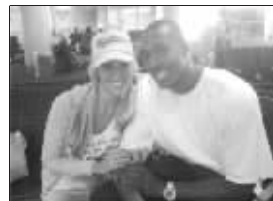
霍华德与艳星亲密合影

德怀特·霍华德从出道至今一直给人们留下了憨厚大男孩的形象,然而近日却传出了他与美国AV界艳星有染的消息,不禁令人唏嘘不已。据美国AV界艳星玛丽·凯利在接受采访时自曝,她和霍华德交往已经有些日子了,并且一直在互通短信,这也成为二人交往的证据。不过霍华德并未对此事进行回应。