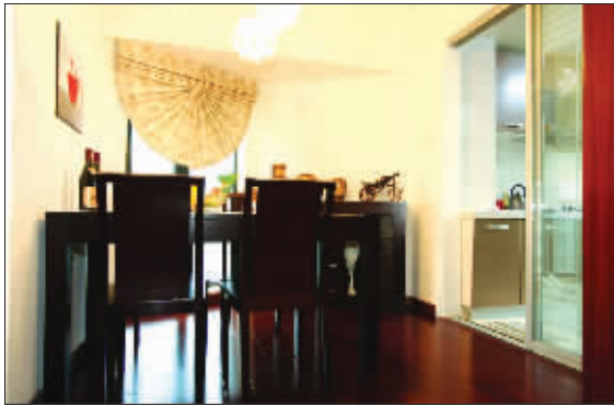
鑫屋地板率先提出十项无忧金牌服务

任何一个品牌的发展,都离不开客户的支持与信赖。作为一个有着十年历史的中国著名地板品牌,鑫屋地板将在其迎来十年庆典之际,委托快报《居家》为其寻找10位十年老客户。鑫屋地板将给10位客户免费赠送“终身保养卡”,并颁发“荣誉顾问”证书,如果他们再度购买鑫屋地板,还可在最低价基础上优惠20%。