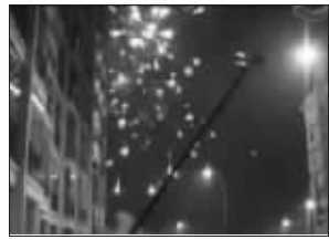
“求爱”现场燃放的烟花

视频画面中,一群学生模样的年轻人正在一个男青年的带领下,沿着校园的水泥路面涌向一栋宿舍楼前,这名男青年情绪似乎很是激动,手上拿着一张纸,双手作喇叭形状对着女生宿舍楼上拼命地大喊“我爱你!我就按照我们的约定开始吧,所有楼上楼下的弟兄