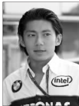
董荷斌是个帅小伙 资料图片

中国车王争霸赛昨天在国家体育场进行,经过激烈较量,荷兰籍华裔车手董荷斌和韩寒从16人中脱颖而出赢得前两名,他俩将代表中国参加今天进行的ROC世界车王争霸赛国家杯的比赛,将与舒马赫一较高下。