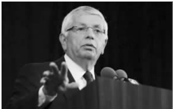
斯特恩又要头疼了