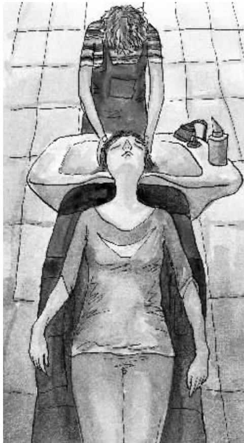
绘图/鲁嘉 插画师 美国S&P插图奖获得者 已婚

周六去了鼓楼那家新开的美发店。阳光透过大大的落地窗,把屋子照得暖融融,亮堂堂,洗头小妹很专业,也很用心,我躺在那里差点睡着了。既然分手了,就让他从我的世界彻底消失吧。