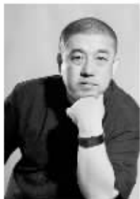
中央亚光亚老史设计工作室 老史 首席设计师