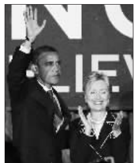
奥巴马(左)和希拉里 美国国务卿希拉里上任约9个月以来,在外交舞台上

表现活跃。针对坊间猜测希拉里是否遭“边缘化”对待,奥巴马顾问人员瓦莱里·贾勒特告诉路透社记者:她的声音受到尊重、得到倾听,她是他(奥巴马)内阁团队的强有力成员,也是外交团队领军人物。”