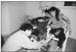
右图为工作人员检查宿舍被爆炸损毁的情况。