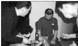
中国驻伊大使馆工作人员为受伤的中国厨师包扎伤口(左、中)。右图为工作人员检查宿舍被爆炸损毁的情况。

新华社记者看到,大批伊拉克安全部队士兵和消防车、救护车飞速赶往现场,曼苏尔饭店门口满是炸毁的汽车残骸,有的汽车还在持续燃烧。一名现场目击者说,他当时正在附近的停车场,爆炸发生后,他看见到处是尸体的碎片,人们惊恐地四处奔逃。