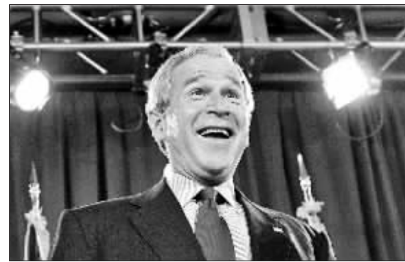
下一步小布什将会成为一名高薪励志演讲者

当美国前总统小布什离任时,其支持率跌到了惨不忍睹的22%。由于政绩不佳,小布什“激励”大量美国选民投票选举民主党候选人,而下一步小布什将会成为一名高薪励志演讲者。