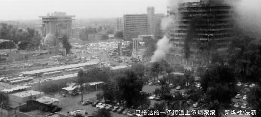
巴格达的一条街道上浓烟滚滚

消防人员抵达现场后开始灭火,并使用云梯试图进入司法部大楼高层房间,试图救援可能被困其中的人员。