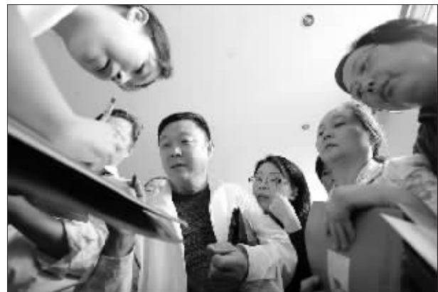
艺考咨询会引来不少家长