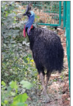
食火鸡在巡视新家

在景色优美的林间小溪边漫步,一只只袋鼠就在你身旁蹦来蹦去,还不时表演“拳击赛”。这不是童话,也不是在澳洲森林里。一个星期后,在南京就可以实现!