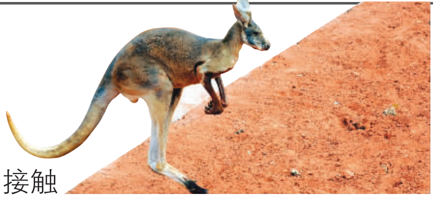
袋鼠高兴地在红土地上蹦来蹦去