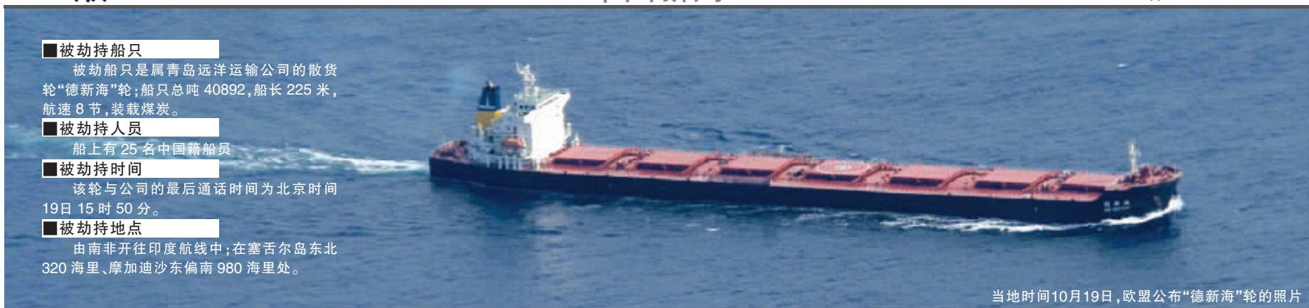
当地时间10月19日,欧盟公布“德新海”轮的照片