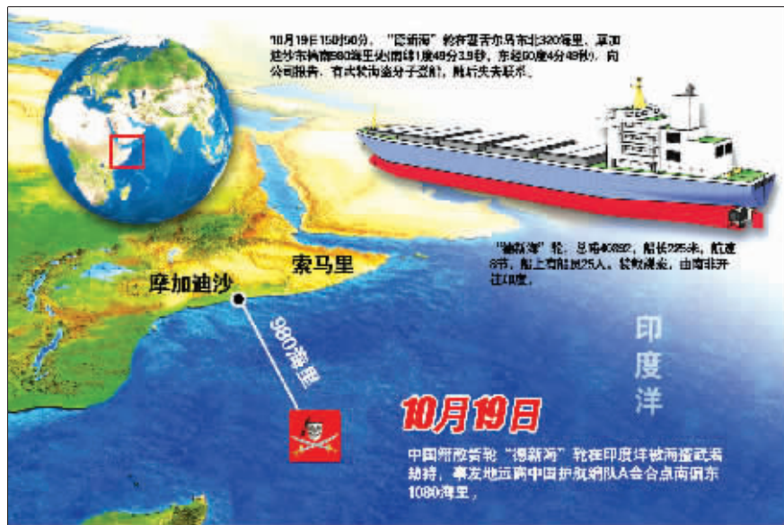
中国籍货轮印度洋遭劫持示意图