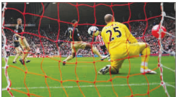
怎么有两个球?我扑哪个啊?

对于这个进球,雷纳和利物浦其他球员都表示应该无效,因为根据国际足联的相关规定,比赛场内一旦出现与比赛不相干的任何物体时,裁判都必须暂停比赛清理赛场,然而当值主裁判麦克·琼斯并没有这样做,还判定进球有效。赛后,前英超裁判杰夫·温特表示:“从比赛画面可以清楚看到,气球干扰了正常比赛,所以此球应被判为无效。”利物浦主帅贝尼特斯赛后承认,有些东西是无法改变的,“那可能是个进球,这很难说。反正在这场比赛中,这球就算进了。”当事人之一的雷纳赛后接受采访时则说:“那真是诡异的进球,当时我真的不知所措。”(新文)