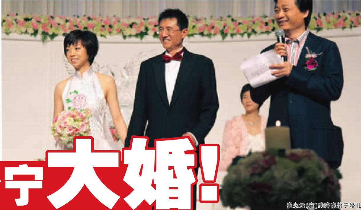
崔永元(右)助阵张怡宁婚礼

张怡宁嫁人了!虽然已经拿过大大小小无数冠军,奥运会四次站上最高领奖台,刚刚又蝉联女团、女单两项全运会冠军,出任全运会北京代表团旗手,不过这些对于张怡宁来说,都并不是她最漂亮的时刻。直到昨天,一身白色婚纱的张怡宁难得露出羞涩的笑容——对于一个女人来说,结婚的这一刻更胜数枚金牌。而传说中的新郎也终于大大方方露面了——一名成功的金融界精英。