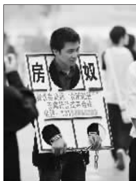
头戴枷锁、手扣铁链的男子

远程教育方面的投资,日子过得还可以。但自从今年8月份他在乐山按揭了一套房子,付过10多万首付后,生意上已经没有钱再投资,陷入周转困境,每月还面临着几千元的房贷,感觉一下子被压得喘不过气来。想到自己还有一个注册成功的餐饮商标,一直没有找到人合作,所以“出此下策”。