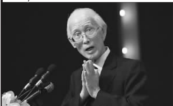
余光中也是情诗高手

不谈乡愁,改谈爱情。昨天下午,南京大学举办第四届读书节名家讲座,整整一个半小时的时间内,台湾著名诗人余光中一直在聊“爱情和诗”。白发苍苍的