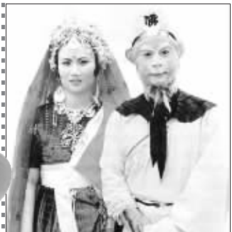
六小龄童夫妇在《西游记》中