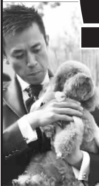
二人的爱犬负责送婚戒