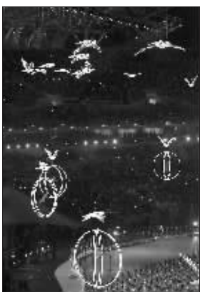
“威亚”的作用很大

昨晚8点,第十一届全国运动会开幕式在济南奥体中心体育场正式上演!去年北京奥运会的成功举办,为今年十一运会树立了一个极好的效仿对象,以全运会历史上第一个全运村为代表的众多环节都让人们很容易地联想到一年前的北京奥运会。而昨晚这场持续了两个多小时的开幕式同样让人感受到了浓浓的“奥运味道”,无论是整个开幕式的规模还是表演环节,都给人一种“向北京奥运看齐”的感觉。