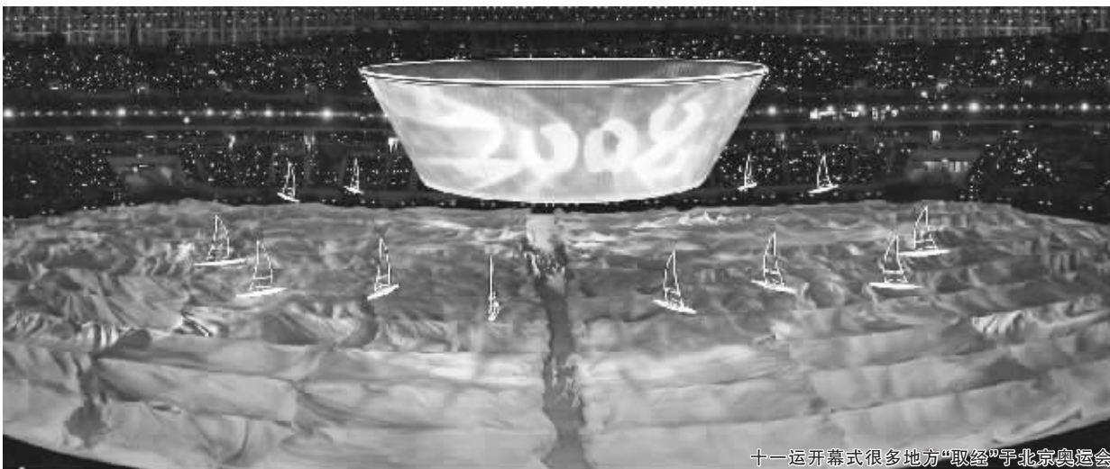
十一运开幕式很多地方“取经”于北京奥运会