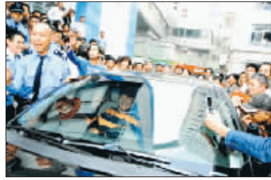
出院时大量群众欢送