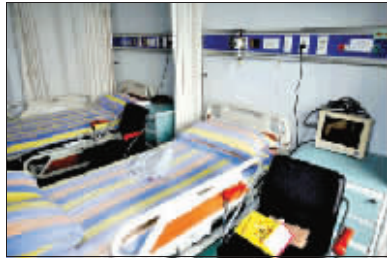
赵本山住过的病床

昨天是赵本山出院后的第一天,在上海西郊的小白楼静养的老赵过得并不安静,不但来访的朋友众多,还有媒体在小白楼外伺机守候。虽然老赵目前的情况还好,但为了防止被媒体打搅,赵本山今日将搬到一个有严格警戒的地方,据悉,这个新租下的别墅,每日租金就高达3.8万元,如果静养一个月要花费上百万元,而整个治疗过程,赵本山至少花了近20万元,不过相对于赵本山30亿元的身家,这点费用不过是九牛一毛。