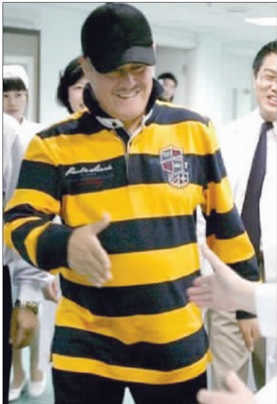
赵本山昨日喜气洋洋出院