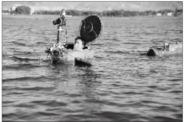
“山寨”潜艇终于试水成功