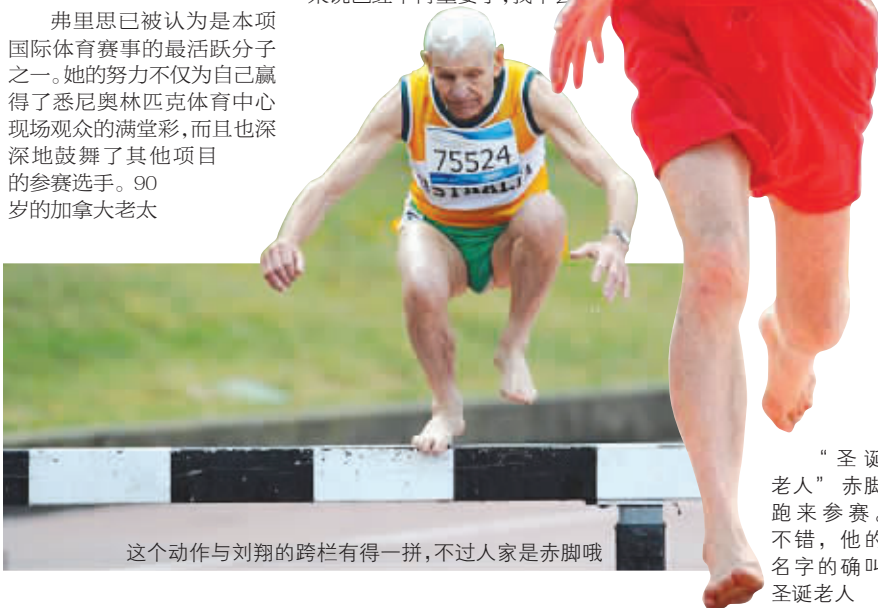
这个动作与刘翔的跨栏有得一拼,不过人家是赤脚哦

去想自己已经达到100岁或即将超过100岁。人们应该快乐过好每一天,而不是过于关注自己的年龄。”中国日报