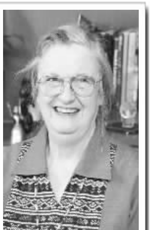
埃莉诺·奥斯特罗姆(Elinor Ostrom)美国公民,女,1933年生于洛杉矶。1965年获加州大学政治学博士学位。现任印第安纳大学政治学教授。

北京时间昨晚7时许,瑞典皇家科学院公布了今年诺贝尔系列奖项中的最后一项大奖——经济学奖。这一次的幸运儿是印第安纳大学的女教授埃莉诺·奥斯特罗姆以及加州大学的奥利弗·威廉森,两位大耄老人共同分享了今年的诺贝尔经济学奖,以及总计1000万瑞典克朗(约140万美元)的奖金。