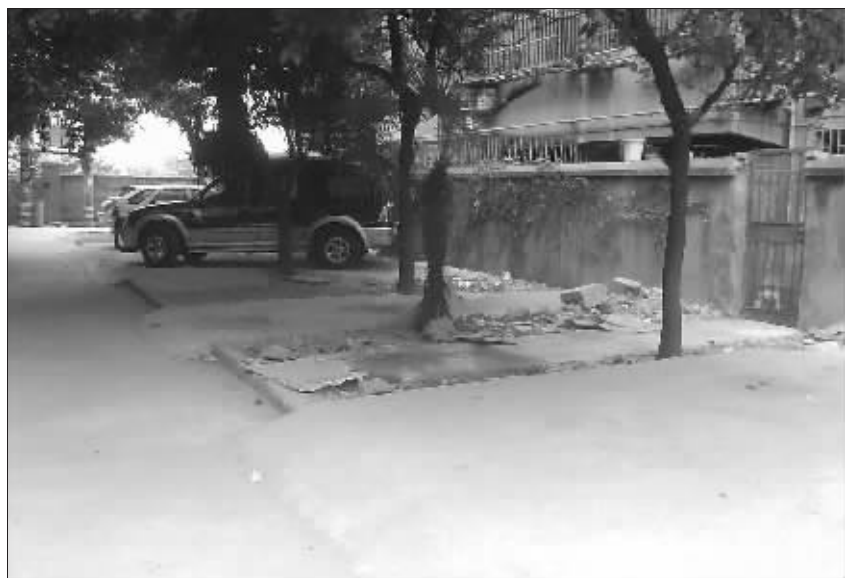
这些用来停车的水泥地原本是小区绿化带

昨日,家住中桥建工宿舍的尤先生来电反映,自家所住的公寓大楼对面的绿化竟然全部被毁,取而代之的是一块坚硬的水泥地,原本的绿化带被人改建成了停车场。