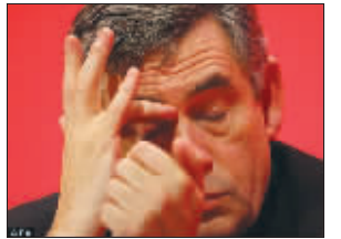
布朗面临“失明”危险

布朗16岁时打橄榄球出意外，后来失去了左眼的视力，另一只眼睛的视力也很差。王菁(中国日报)黎黎(新华社)