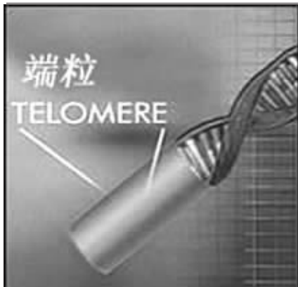
端粒示意图 资料图片