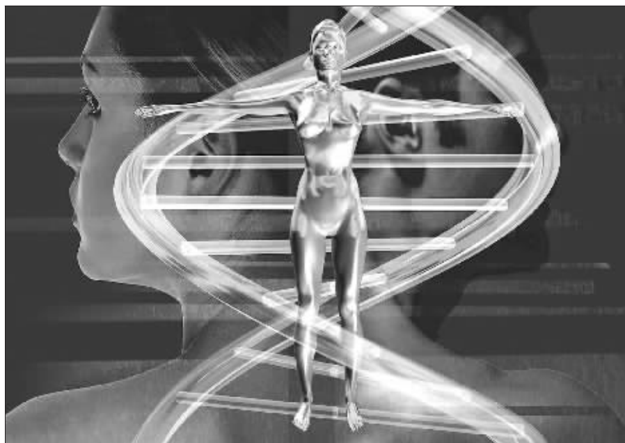
如何延长寿命,是人类一直在探究的问题 资料图片