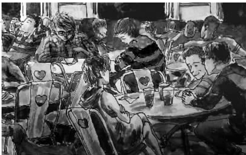
绘图/鲁嘉 插画师 美国 SND 插图奖获得者 已婚

我们依旧是在那个校园餐厅,依旧还是坐那个座位,我们静静地搅拌着自己的那杯卡布其诺,时光好像又回到了从前…… 在十一的聚会上第一眼看见你的时候,我鼻子有些发酸。分别两年了,你还好吗?