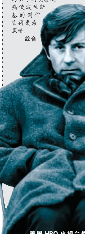
美国HBO电视台播出了有关波兰斯基强奸案的纪录片,这是纪录片的封面