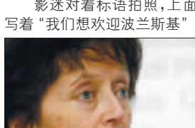
瑞士司法部官员在记者会上