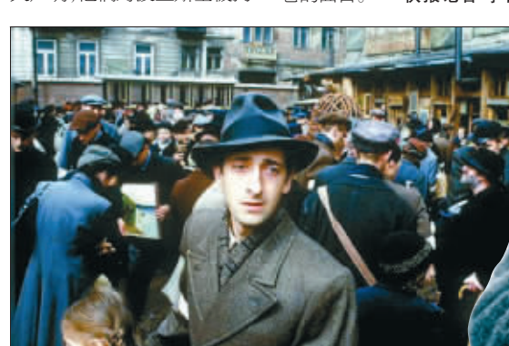
波兰斯基代表作《钢琴师》剧照