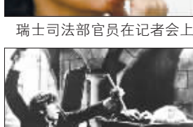
波兰斯基也是个出色的演员,他在《天师捉妖》中自导自演