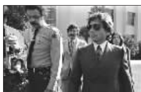
波兰斯基当年被洛杉矶警方收押

去年,美国HBO电视台播出了有关这起强奸案的纪录片《罗曼·波兰斯基:被通缉的与被需要的》。片中披露,这一案件在审理过程中有暗箱操作的嫌疑。波兰斯基也认为自己受到了不公正的待遇,从去年年底开始通过他的律师要求洛杉矶高等法院撤销当年的强奸少女指控,理由是有最新证据表明,当初检察机关和法院方面对案件的处理都存在偏差,并请求法院撤销这一案件。不过,法官驳回了这一请求。