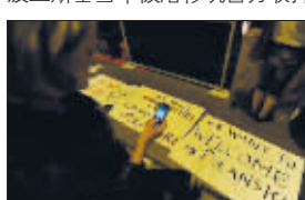
影迷对着标语拍照,上面写着“我们想欢迎波兰斯基”