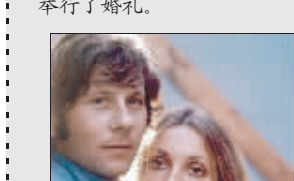
波兰斯基与已故妻子旧照

1963年,波兰斯基离开了相对闭塞的波兰,开始了周游列国般的创作生活,荷兰、法国、英国都留下了他的足迹。这段时间,波兰斯基接二连三地到英国、美国、法国和意大利拍摄了七八部影片。在《天师捉妖》的拍摄过程中他结识了女星莎朗·塔特,两人一见钟情并于次年1月在伦敦正式举行了婚礼。