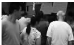
②在济南:糖尿病患者争先恐后的抢购参花消渴茶,生怕自己错过了优惠活动!