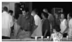
③在北京:参花新老会员排队在服务中心等候买药,并向专家详细咨询!