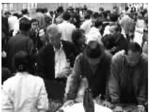
①在南京:到服务中心购药的参花新老会员争先恐后,个个喜笑颜开,纷纷称赞参花为糖尿病人带来福音!

《参花有约》健康栏目指导糖尿病人在治疗过程中“五驾马车”综合治疗,配合参花+渴康黄金组合的独特疗效,160余种并发症全部治愈,使糖尿病人重新走上健康之路!谈起参花消渴茶,糖尿病人都点头称赞!