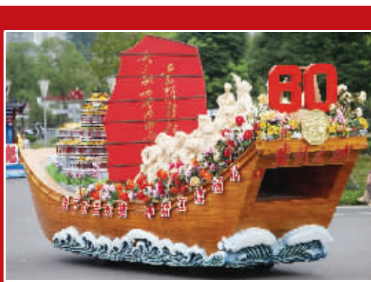
▲“胜利之城”花车造型别致