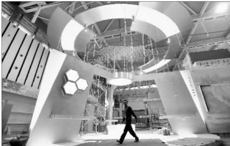
工人们正在紧张布展(9月20日摄)

3000多幅图片,“铺”出了60年的巨大跨越。据介绍,这次展览面积2万多平方米,是江苏历史上同类展览中规模最大的一次,大量运用史实图片、实物进行展示。展览共分四个部分:第一部分“历史巨变”,集中展示在党中央亲切关怀和省省委省政府坚强领导下,江苏大地发生的翻天覆地变化。第二部分“辉煌成就”,主要展示江苏经济、政治、文化、社会以及党的建设取得的巨大成就。第三部分“共同发展”,主要展示各省辖市经济社会发展的亮点和特色。第四部分“美好未来”,主要展示江苏发展新目标、各界人士新寄语、放飞梦想新憧憬。