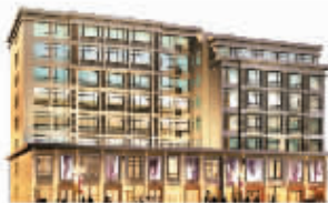
金轮·华尔兹小公馆

本广告非要约邀请, 其中涉及的文字、图片仅供参考, 有关买卖双方的权利义务, 以政府部门核准的正式、双方签订的合同为准。本公司保留对以上资料进行最终解释权修改权。