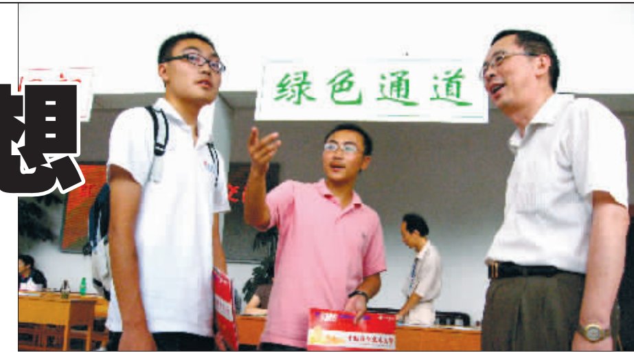
2008年8月,行将卸任的中科大校长朱清时和来自北川灾区的两位新生亲切交谈

赴南方耕种一块“教授治校”的试验田。民间对此颇为动容,寄予厚望。网络间有中科大校友留言打气:“老校长,加油!”网名“笔架山人”的深圳网友对他提出八点期盼,第一点就是希望严格把关生源,“不要重走深圳大学的老路,迁就深圳考生上大学的意思,降低以求。”第二条很有意思,“对社会上的不良风气一定要抵制,哪个局长给您写条子,甭理他,您把他贴这里(论坛)来,我们替您人肉他。”网友“欺负老实人”直言“看好南科大,绩优股”,并表示“如果明年能招生,就动员侄子除香港那边的大学外优先报考”。