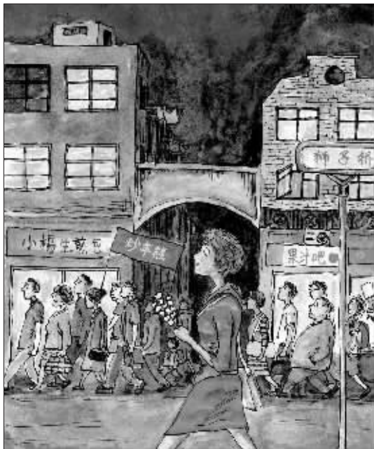
美国《纽约》插图奖获得者 已婚 绘图、鲁嘉 插画师

一个人很满足呀。 然冒出一个问题:男朋友是用来做什么的? 度干掉了它们。嘴巴大就是方便,在路上突 丸子,一手拿着红宝蛋糕,用我一贯的速 小吃街超级热闹,我一手拿着章鱼小