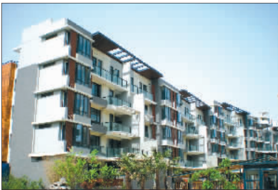
山水云房备受追捧

9月12日,知名的花庭洋房——山水云房第三季从容亮相,经典洋房户型正式接受预约排号,吸引了众多市民的关注,现场热销异常火爆。山水云房以优质的建筑形态,完美的自然景观及良好的未来前景,再次向市场证明,优质生活必将备受追捧。