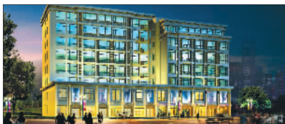
金轮·华尔兹公馆气质优雅

金轮·华尔兹公馆,西紧邻金轮国际广场,南为金鹰国际购物中心,东有金陵饭店、地处新街口CBD核心商圈的正中心,占据了新街口金三角核心。华尔兹公馆推出30-50平方米的mini小公馆,不仅