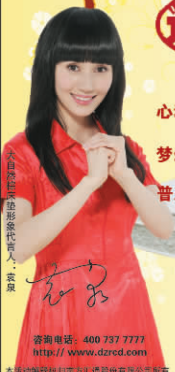
大自然意境床垫形象代言人:袁泉