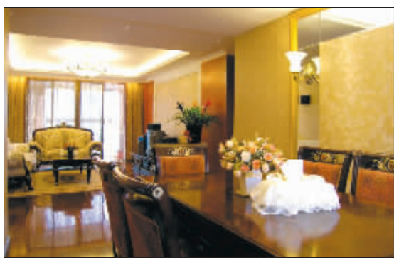
易居空间设计出品

进入 9 月,易居空间装饰的施工材料、工艺将全面升级,工程造价不但升级不加价,反而将推出 7.8 折的优惠。记者了解到,全新亮相的易居空间有以下三大亮点值得关注。