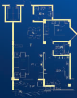
示范单位 1户型 两房两厅一卫 约90m 2