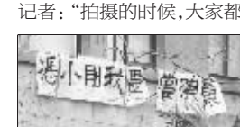
在东大拍摄时,学生打出条幅

个上海洋行。而在东大礼堂倒是有些南京的戏份,其中南京演员陶泽如也在此客串了一些戏份。