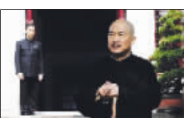
蒋介石(张国立)与蒋经国(陈坤)在南大办公楼门口

南京大学的礼堂是民国时期的老建筑,在南京大学这座礼堂前《建国大业》拍摄了一场比较重要的戏,那就是蒋介石(张国立饰)与蒋经国(陈坤饰)一场特殊的对话,相对于美龄宫一天半的拍摄,《建国大业》在此只拍摄了不到一个下午的时间,因为是外景戏,所以为了避免引发学生围堵,影响拍摄,剧组特意选择在上课时间拍摄,而且拍完就立刻撤离了南京大学。