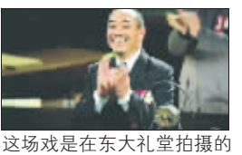
这场戏是在东大礼堂拍摄的