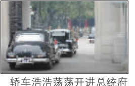
轿车浩浩荡荡开进总统府