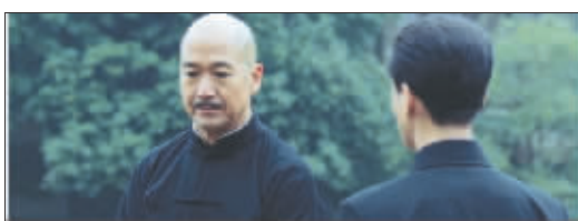
▲音乐台上“父子”对戏 ▲杜月笙(冯小刚)与蒋经国(陈坤)在东大老图书馆顶楼 ▶国民党在东大礼堂开大会