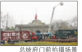
总统府门前拍摄场景